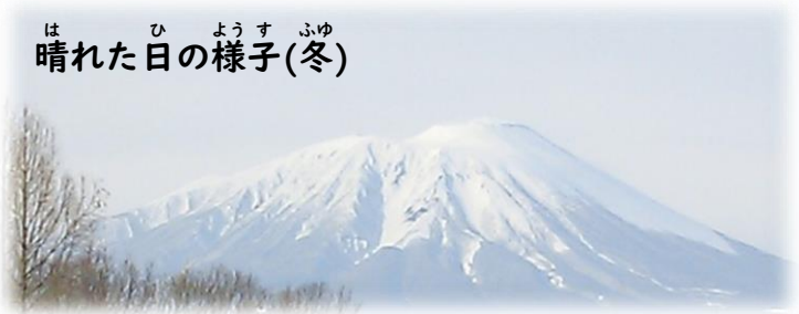
は ひ よう す ふゆ 晴れた日の様子(冬)